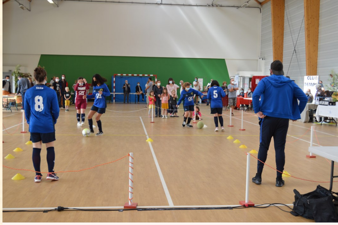
CSAP, section féminine de football

Vous pouvez à nouveau pratiquer votre sport ou votre hobby habituel dans un contexte presque normal, sous réserve de nouvelles instructions gouvernementales.