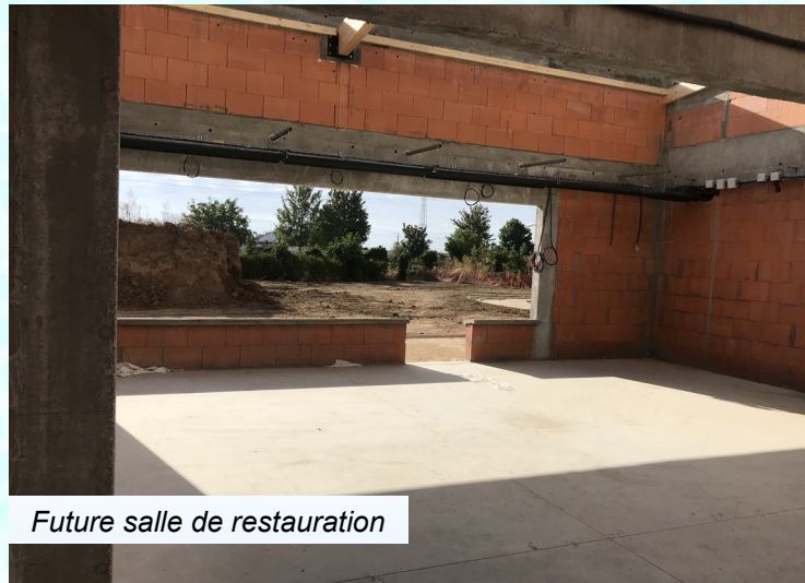
Future salle de restauration