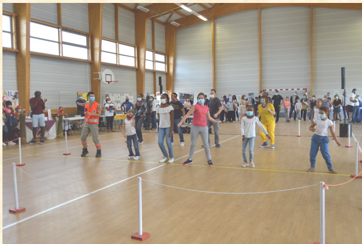
Danse avec « Cocktail des Iles »