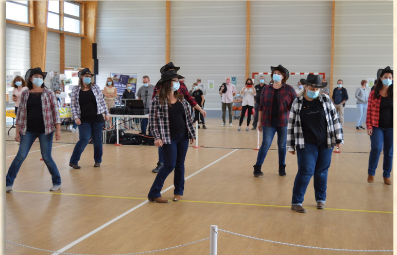
Danse country avec l'association « Gym et Danse »