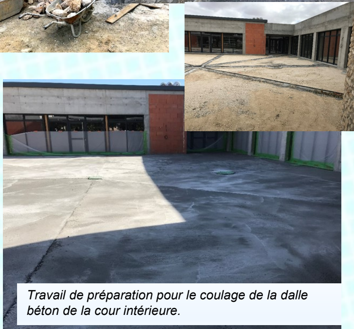
Travail de préparation pour le coulage de la dalle béton de la cour intérieure.