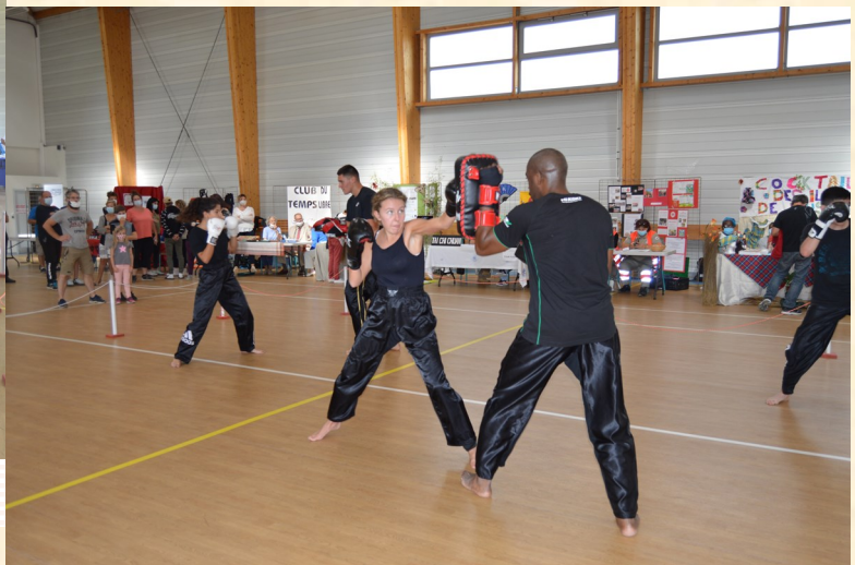
« Full Boxing Academy »