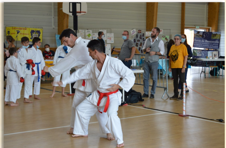
« Okinawa Karaté Essonne Sud »