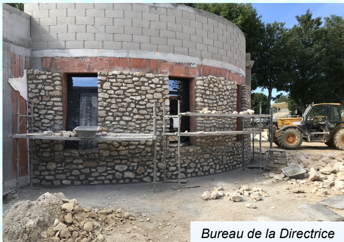
Bureau de la Directrice

Pose, sur certaines façades, de pierres naturelles, taillées et ajustées à la main par les maçons de l'entreprise de gros œuvre.