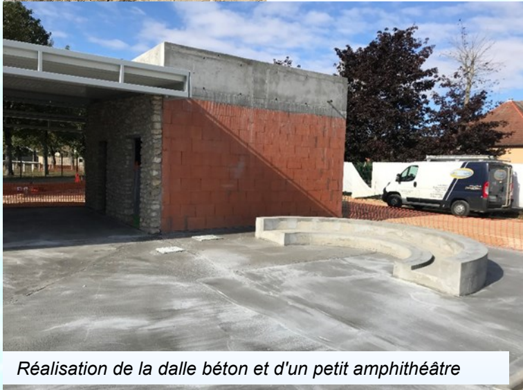
Réalisation de la dalle béton et d'un petit amphithéâtre