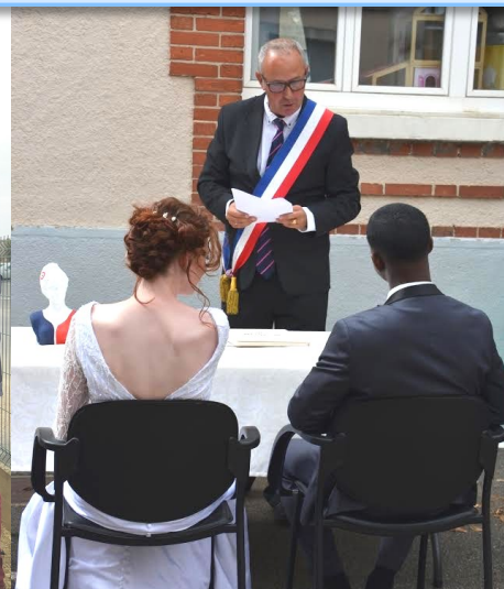
Mariage à Pussay