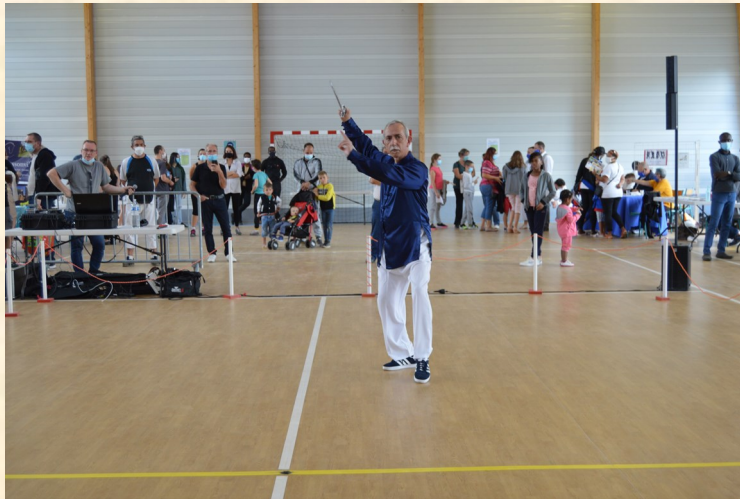
Tai-chi avec l'association « Toum Pussay »